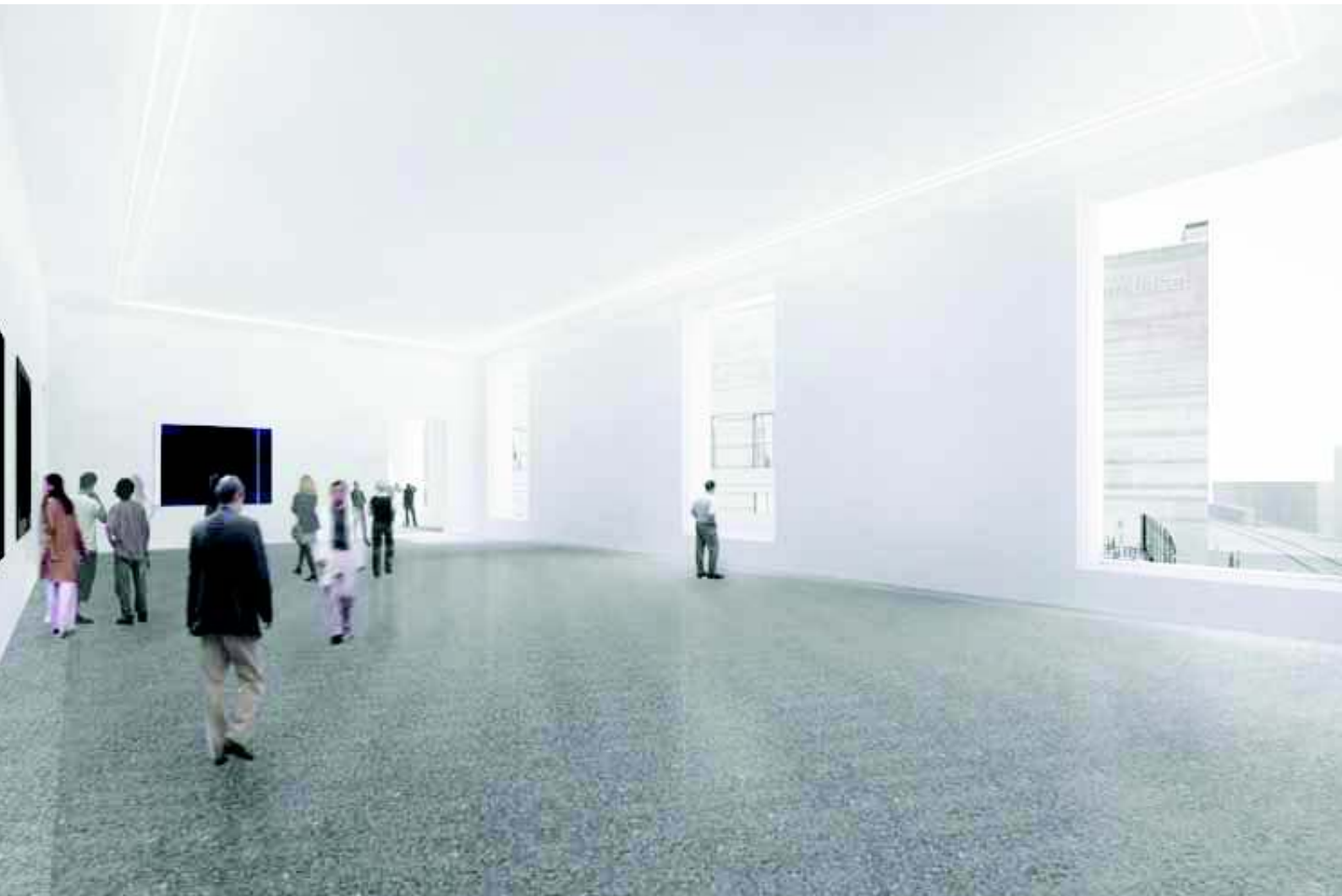
Seitenlichtsaal im 1. Obergeschoss

Öffnungszeiten: Di–So 10.00–18.00 Uhr. Mo geschlossen.