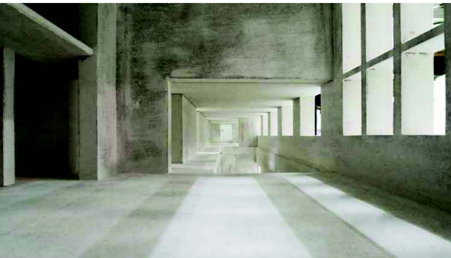
Blick auf den neuen Treppenabgang