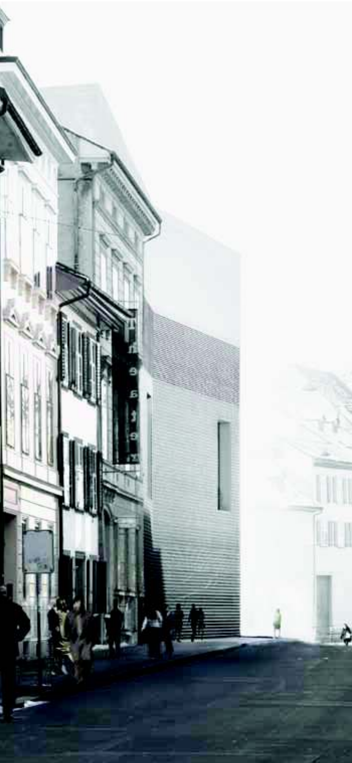
Blick aus der St. Alban Vorstadt