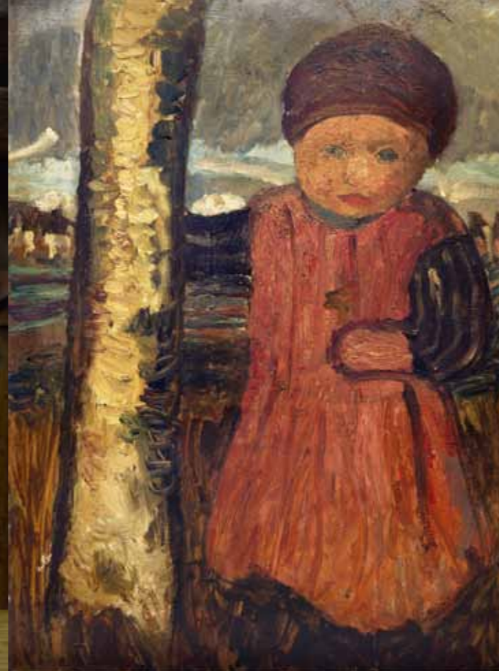
Paula Modersohn-Becker Kleines Kind neben einem Birkenstamm, 1904

Am Freiburger Münsterplatz baute sich der durch sein Schaffen zu grossem Wohlstand gelangte Wentzinger ein repräsentatives Wohnhaus, das heute das Museum für Stadtgeschichte beherbergt. Es dient als weiterer Ausstellungsort und ist selbst ein besonderes Highlight.