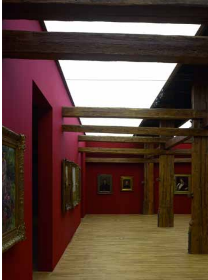
Augustinermuseum – Städtische Museen Freiburg

Freiburg baroque_Johann Christian Wentzinger und seine Zeit _Der dreihundertste Geburtstag von Johann Christian Wentzinger (1710–1797) ist Anlass für eine grosse Retrospektive in der Ausstellungshalle im Augustinermuseum. Der vielseitig begabte Barockkünstler war als Bildhauer, Maler und Architekt tätig und gehört zu den bedeutenden deutschen Künstlern des 18. Jahrhunderts. Werke der Sammlung und zahlreiche prominente Leihgaben aus Deutschland, der Schweiz und Österreich repräsentieren sein Œuvre. Arbeiten wichtiger Zeitgenossen werden zum Vergleich herangezogen und zeigen seinen Einfluss auf andere Künstler.