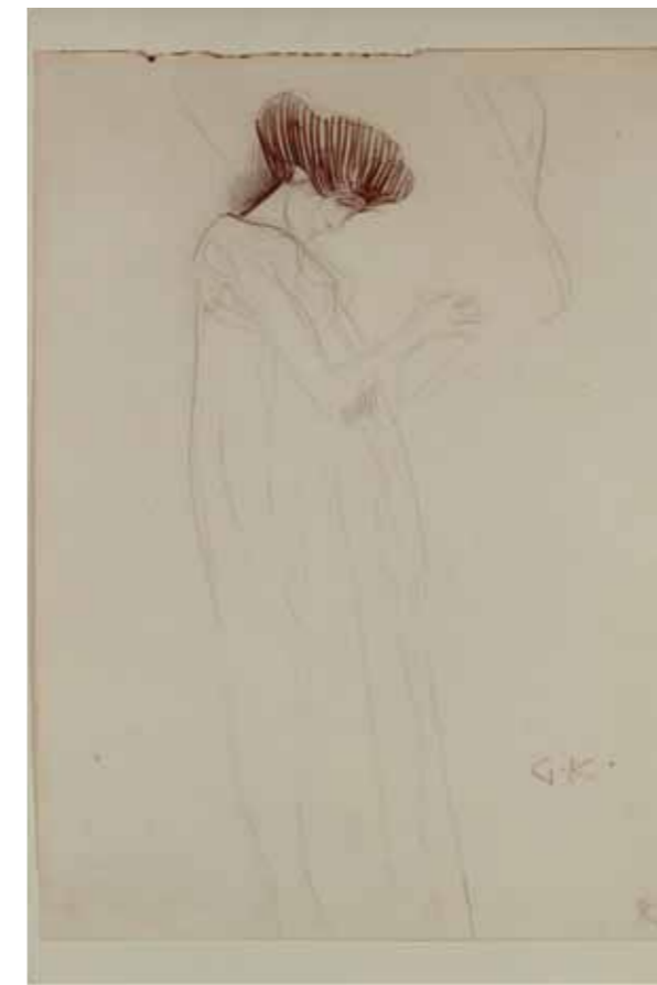
«Poesie» von Gustav Klimt, Bleistift auf Papier 39.6×30 cm, 1902

Ein «Lieblingsbild» aus der eigenen Sammlung sollte beschrieben werden – aber gibt es das überhaupt? Sind nicht alle Bilder eines Sammlers seine «Lieblingsbilder?» In meinem Fall müsste die Frage sowieso «Lieblingszeichnung» heissen, da meine Sammlung im Wesentlichen aus Zeichnungen besteht die vor allem aus dem 19. und 20. Jahrhundert stammen. Das faszinierende für mich bei Zeichnungen ist – in einem gewissen Gegensatz zum Bild – die Spontaneität, in der sie in der Regel entstanden sind. Passt eine Zeichnung dem Künstler nicht, schmeisst er sie weg und macht eine neue – oder macht eine Serie und sucht dann die beste aus.