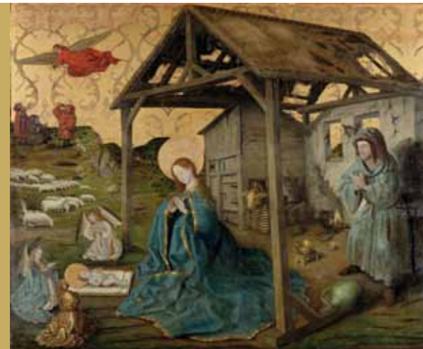
Konrad Witz (um 1400 – um 1446) Geburt Christi, um 1450 | Bild auf Tannenholz | Blatt: 135x165 cm, Gottfried Keller-Stiftung

Liebe «Freunde» Wir danken Ihnen für die tatkräftige und treue Unterstützung und freuen uns auf ein neues, spannendes und inspirierenden «Museumsjahr» mit Ihnen. Ihnen und Ihrer Familie wünschen wir frohe und unbeschwerte Festtage, eine Zeit der Ruhe und Erholung sowie Gesundheit und Erfolg im neuen Jahr.