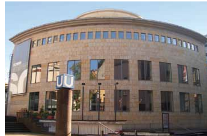
Schirn, Kunsthalle Frankfurt