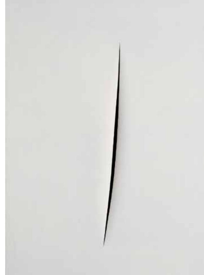
Lucio Fontana, Concetto Spaziale, Attesa, 1962 © VG Bild-Kunst, Bonn 2010

Anfahrt: Das Augustinermuseum und das Museum Neue Kunst erreichen Sie ab dem Hauptbahnhof mit der Stadtbahn Linie 1 Richtung Littenweiler bis Haltestelle Oberlinden