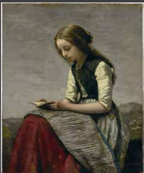
Jean-Baptiste Camille Corot, Lesendes Mädchen, um 1855–1865 Öl auf Leinwand, 46x38,5 cm, Sammlung Oskar Reinhart «Am Römerholz», Winterthur

Das Römerholz feiert seine Wiedereröffnung mit der Inszenierung seiner hochkarätigen Sammlung in den renovierten Räumlichkeiten. Zeitgleich präsentiert das Kunstmuseum Winterthur die Sonderausstellung «Die Natur der Kunst: Begegnungen mit der Natur vom 19. Jahrhundert bis in die Gegenwart».