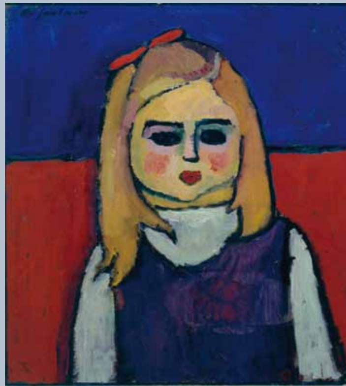
Alexej Jawlensky | Kind um 1909 Sammlung Im Obersteg Oberhofen

Die Stiftung Im Obersteg fokussiert in einer integralen Überblicksausstellung ihrer Sammlung auf die Freundschaften Karl Im Oberstegs mit seinen Künstlern. Die teilweise umfangreiche Korrespondenz mit Cuno Amiet, Robert Genin, Marc Chagall, Alexej von Jawlensky u. a. zeugt von intensiven freundschaftlichen Kontakten. Die Künstlerbriefe geben Einblick in die Entstehungsgeschichte der Sammlung und lassen den Geist der Zeit von 1920 bis 1950 erwachen. Die Ereignisse während und zwischen den Weltkriegen prägten die europäische Kunst. Für viele im Ausland verfernte Künstler war die neutrale Schweiz Zufluchts- und Überlebensort, wo ihnen Persönlichkeiten wie Karl Im Obersteg dringend benötigte Unterstützung boten. Umgekehrt eröffnete die wirtschaftliche Unversehrtheit des Landes den privaten Sammlern auch einzigartige Kaufchancen auf einem qualitativ hohen Niveau. Vor diesem privaten und gesellschaftlichen Hintergrund lässt die Ausstellung die bedeutenden Werke der Sammlung Im Obersteg in einem neuen Licht erscheinen. Weniger bekannte Arbeiten, die als Geschenke der Künstler in die Sammlung gelangten, unterstreichen den intimen Charakter dieser Präsentation.