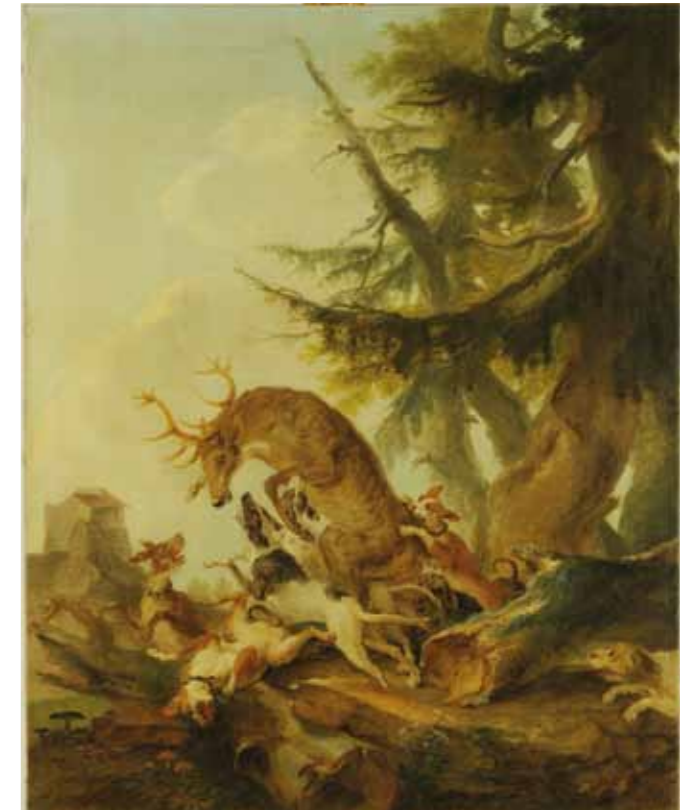
Caspar Wolf «Hirsch, von einer Hundemeute angefallen»

vermenschlichten Kreatur auf Leben und Tod in seiner existenziellen Wucht zu erfassen. An ein berühmtes Rubensbild erinnernd, könnte man sagen, Wolf gibt den Raub der Sabinerinnen gleichsam als Tierstück (Katharina Georgi). Dass die Aussage weit über genrehafte Alltagsschilderung hinausgeht, belegt auch die Auswahl der Sujets: Komplettiert wurde der Zyklus nämlich durch Darstellungen der Jagd auf Eber und Auerochs. Letzterer aber war damals bereits seit Jahrhunderten ausgestorben! Dennoch durfte er als Verkörperung elementarer Gewalt in diesem eigentlichen Ideenstück nicht fehlen.