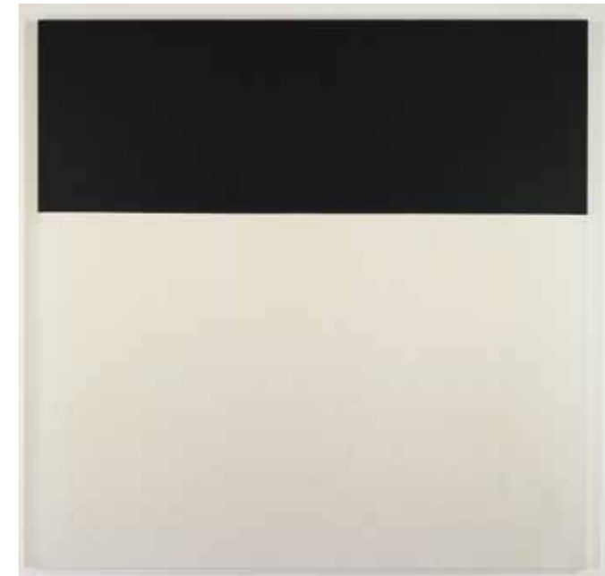
Blinky Palermo «Ohne Titel»