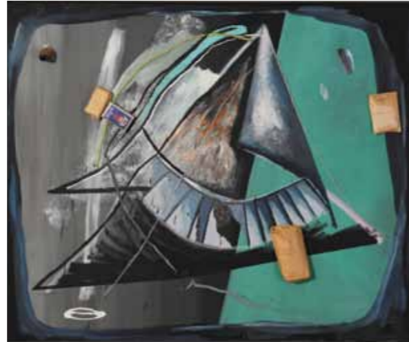
Ertragsgebirge mit Wirtschaftswerten von Joseph Beuys II, 1985

Martin Kippenberger (1953–1997) begriff Person und Werk von Joseph Beuys als Herausforderung und liess diese Einstellung auf seine Arbeitsweise rückwirken. Ertragsgebirge mit Wirtschaftswerten von Joseph Beuys II , ein Gemälde, das bei Kippenbergers erster Museumsausstellung 1986 im Hessischen Landesmuseum Darmstadt in unmittelbarer Nähe zum Werkblock von Beuys gezeigt wurde, verdeutlicht, wie er dabei voringing. Er erwarb bei der Edition Staeck mehrere von Beuys signierte Objekte aus der Serie der «Wirtschaftswerte». Dabei handelt es sich um originalverpackte Lebensmittel und Gebrauchsgegenstände aus der damaligen DDR, die Beuys durch seine Signatur und Stempel zu «Wirtschaftswerten» umwidmete und in den Kunstkreislauf einführte. Assemblageartig brachte Kippenberger sie mit seiner Malerei in Verbindung. Ertragsgebirge mit Wirtschaftswerten von Joseph Beuys II erinnert durch den umlaufenden Rahmen und das schwebende Hauptbild an einen gewölbten Fernsehbildschirm auf Sendung. Das Hauptbild aus ansteigenden Dreiecken greift – sozusagen aus der Perspektive eines Fernsehkonsumenten aus der DDR gesehen, die Struktur eines Wirtschaftsdiagramms auf, das