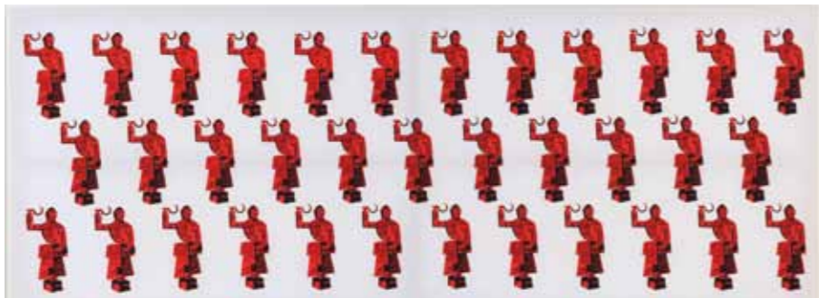
Rosemarie Trockel «Ohne Titel»

Ankauf mit Mitteln der Petzold-Müller-Stiftung