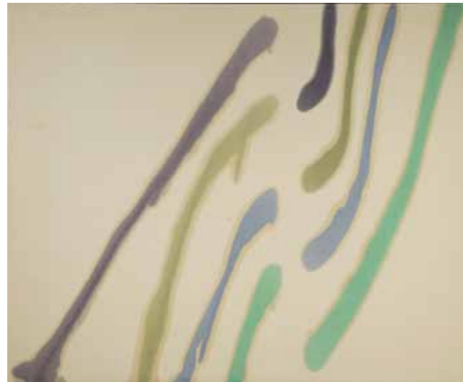
Morris Louis «Delta Khi»

Delta Khi von Morris Louis ergänzt als meisterhaftes Beispiel der amerikanischen Farbfeldmalerei einen bereits umfassenden Bestand an Gemälden der amerikanischen Nachkriegskunst in unserer Sammlung. Louis ist einer der bedeutendsten Color Field Painter, die in den USA den Abstrakten Expressionismus abgelöst haben. Delta Khi von Morris Louis zählt zur umfassenden Werkgruppe der Unfurleds, die Gemälde mit jeweils diagonal verlaufenden Farbstreifen umfasst. Der Künstler untersucht bei den grossformatigen Arbeiten das Verhalten von flüssiger Farbe auf der ungrundierten Leinwand. Dafür verwendet er eine sehr regelmässig gewobene Leinwand aus Baumwolle und eine Polyacrylfarbe (Magna), die er verdünnt. Die Eigenschaften der verdünnten Magna-Farbe, die sich besonders gut mit der unbehandelten Unterlage verbindet, lassen Delta Khi weniger gemalt als gefärbt wirken. Durch Anheben der Leinwand lenkt Morris Louis ohne Pinsel den Farbenfluss und lässt so den Zufall an der Gestaltung des Gemäldes mitwirken. In seiner Erschei-