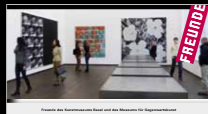
Freunde des Kunstmuseums Basel und des Museums für Gegenwartskunst

Das Kunstereignis van Gogh hat sich auch in einer vermehrten Nachfrage für Mitgliedschaften bei den Freunden ausgewirkt. So musste der starken Nachfrage wegen der Freunde-Mitgliederwerbeflyer nachgedruckt werden. Mit einer Auflage von rund 20 000 Exemplaren wurde eine grosse Werbeaktion im Kunstmuseum gestartet. Bereits jetzt zeichnet sich auch eine kontinuierliche Mitgliederzunahme ab. Der Bekanntheitsgrad des Vereins der Freunde und somit auch der Zweck und die Anliegen, wurden mit dieser Aktion erheblich gesteigert.