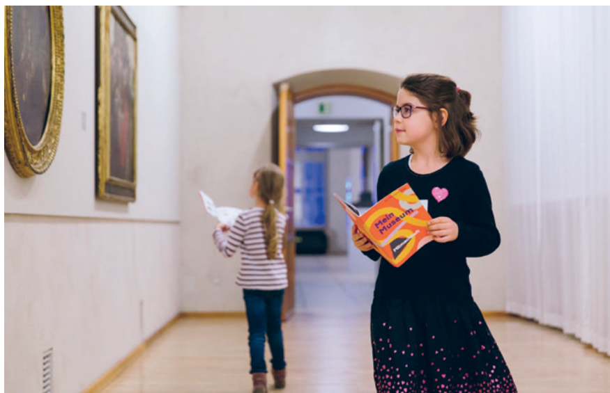
Kindervernissage im Kunstmuseum Basel