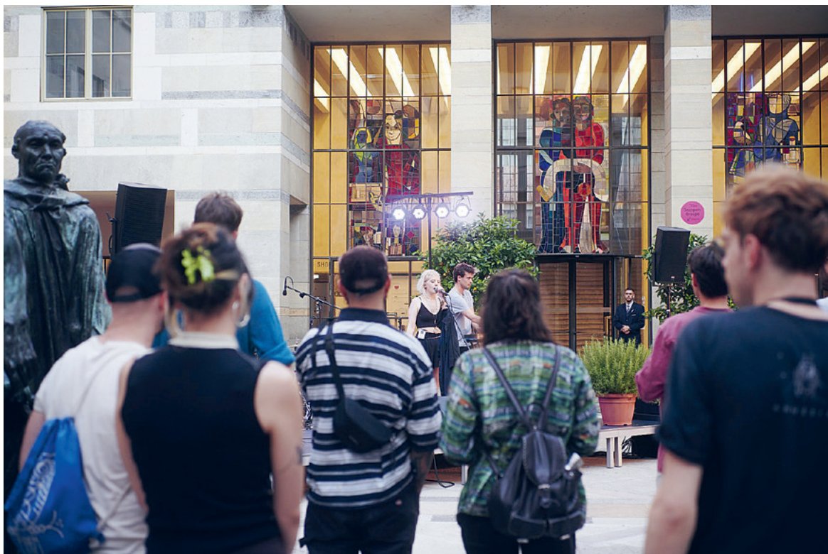
Let's celebrate art! YARD lud dazu ein, im Sommer den Mittwochabend 18–22 Uhr bei einem besonderen Programm im spektakulären Innenhof des Kunstmuseum Basel ausklingen zu lassen.