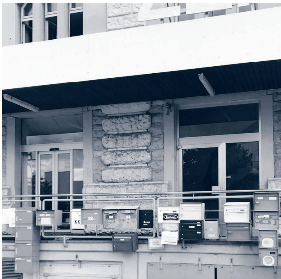
ARK Basel, Archiv Regionaler Künstler*innen-Nachlässe Basel

Das grosse Interesse hat dazu geführt, dass die Plätze meist schnell ausgebucht waren. Wir bedauern sehr, wenn wir nicht alle Anfragen berücksichtigen konnten und danken für Ihr Verständnis. Wir werden auch in Zukunft unser Bestes tun, um Ihnen ein vielfältiges und ansprechendes Angebot an Exkursionen und Reisen zu bieten.