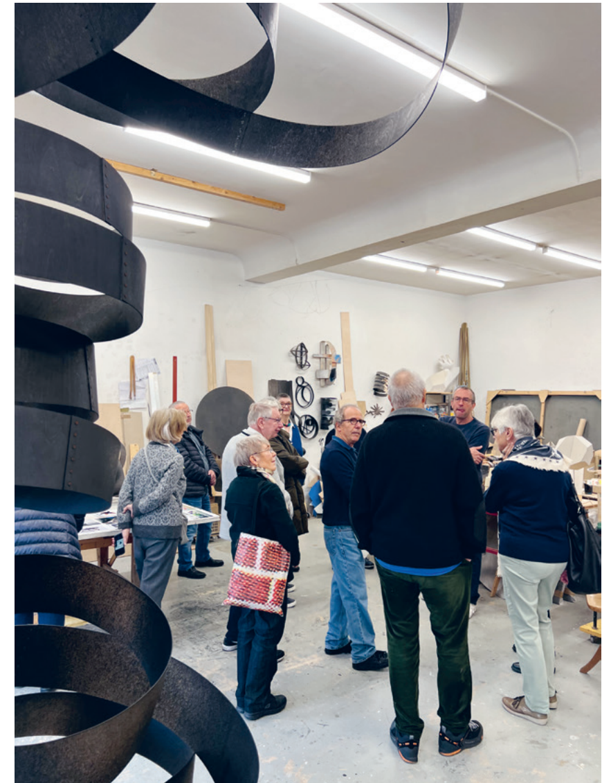
Die Freunde bei Urs Cavelti am 26. November auf Atelierbesuch

GESTALTUNG Stauffenegger + Partner, Basel DRUCK Gemper AG, Basel und Pratteln