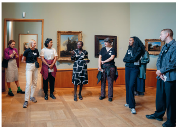
„This is Not a Guided Tour.“ Kunstmuseum Basel. Kunsttage Basel 2023

Vom 25. bis 27. August 2023 fand in der Region Basel die vierte Ausgabe der Kunsttage Basel statt. Drei Tage Kunst an 60 Orten! Erneut machten die Kunsttage Basel moderne und zeitgenössische Kunst für ein breites Publikum erlebbar. Über 60 Museen, Galerien, Ausstellungsräume und Off Spaces nahmen an der gemeinsamen Veranstaltung teil und belebten die Stadt und die öffentlichen Räume von Riehen bis zum Dreispitz-Areal in Münchenstein. Die Kunsttage Basel zielen darauf ab, die künstlerische und kulturelle Vielfalt in der Region Basel weitum sichtbar und breit erlebbar zu machen. Die Initiative möchte damit den kulturellen Austausch fördern und das regionale Kulturleben unterstützen. Die FREUNDE des Kunstmuseums haben die Kunsttage wiederum mit einem finanziellen Beitrag von SFr. 15'000.– unterstützt.