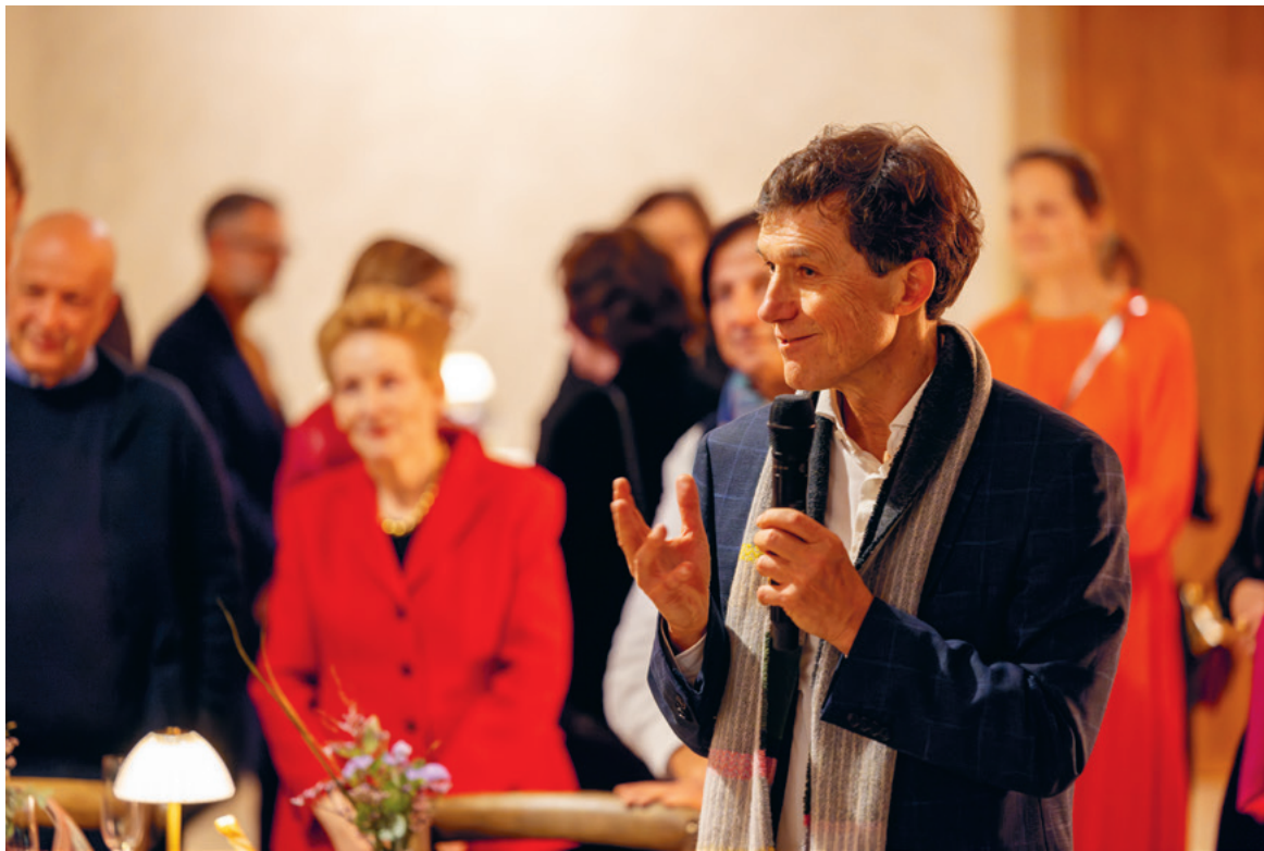
Abschied Dr. Josef Helfenstein