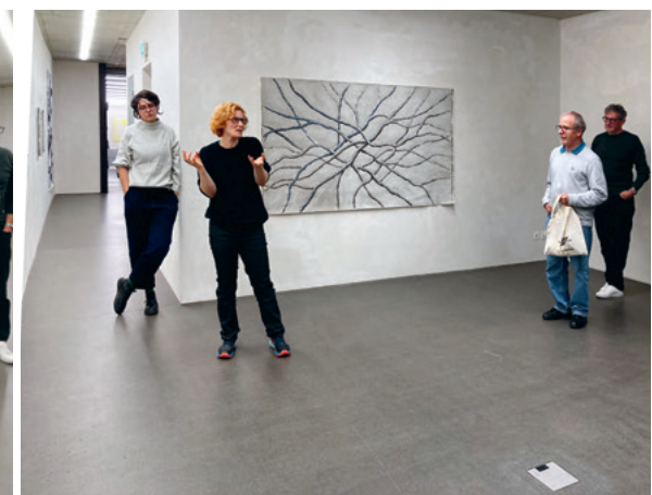
Die FREUNDE im November zu Besuch im „Space25“.