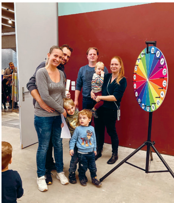
Familientag am Stand der FREUNDE

Unter dem Motto „Das Museum als Atelier“ fand der diesjährige Familientag am 5. November statt. Das Foyer verwandelte sich in einen Malsaal, man konnte sich im Modellstehen üben oder aus recyceltem Karton Pappwelten bauen. Über 8'300 Besucher:innen kamen, so viele wie noch nie. Auch die FREUNDE waren mit dem Glücksrad vor Ort und haben den Anlass massgeblich finanziell unterstützt.