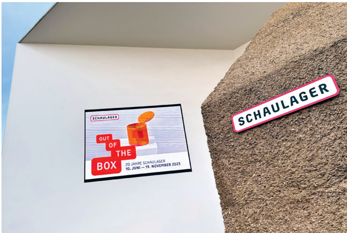
Out of the box – 20 Jahre Schaulager. Exklusive Führung für die FREUNDE durch die Ausstellung im Schaulager.