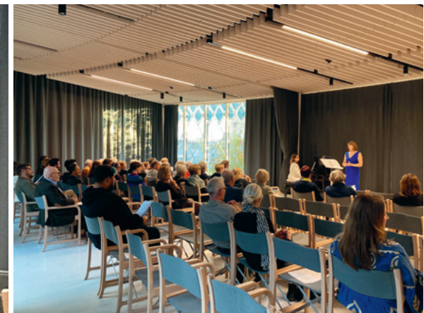
Kunst & Klang Nr. 3, Oktober, Führung durch den Novartis-Campus und Konzert Schalluzination.