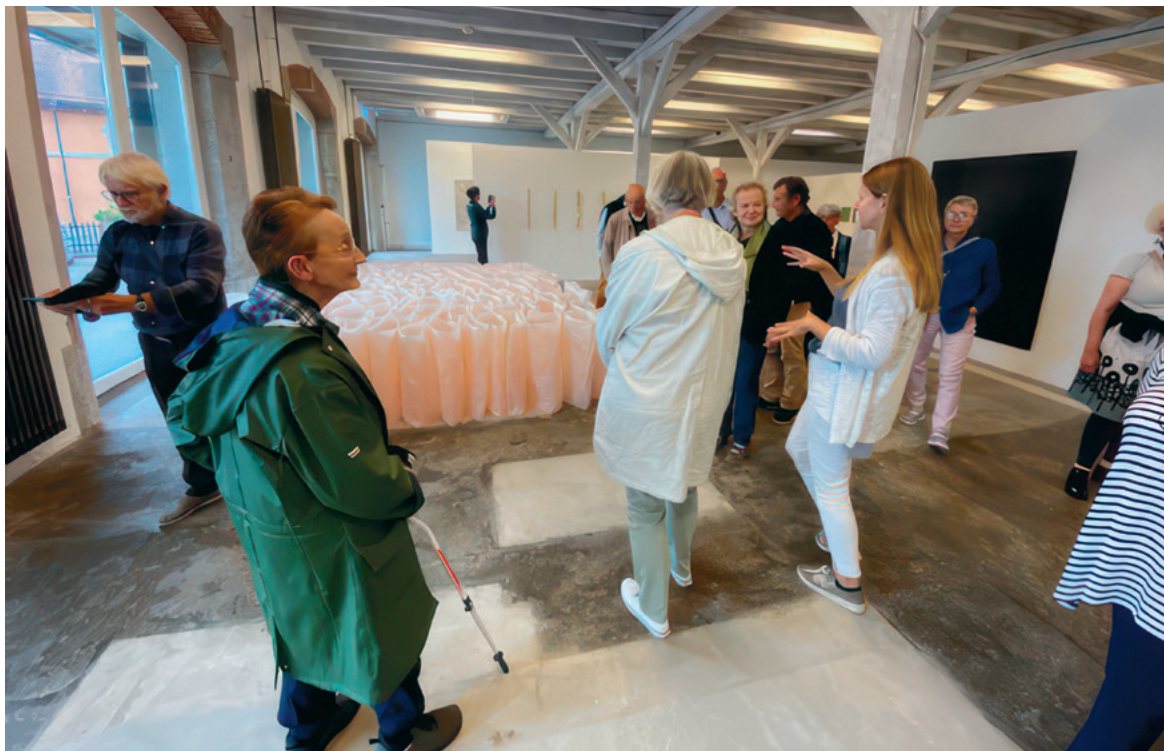
Tagesausflug zur Schweizer Gegenwartskunst, Glarus und Rapperswil-Jona im August.